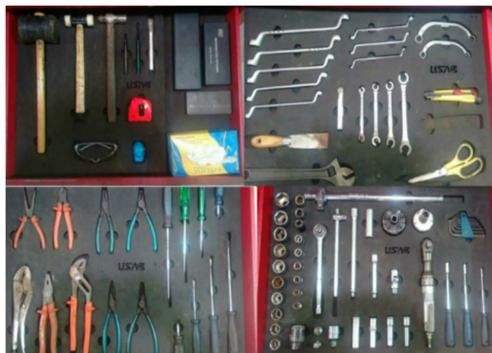
Figura 5: Chaves e Ferramentas organizadas após descarte de peças quebradas

O Seiketsu , coloca em prática todos os sentidos anteriores, colocando a prova se a implantação do programa está sendo efetuada com sucesso. Para atingir o resultado esperado com o Seiketsu a padronização, limpeza, utilização ajudam a conservar e manter a higiene. O programa 5S é um ciclo, portanto não alcança o nível desta parte do sentido, sem antes conseguir realizar os 3S anteriores. O prin-