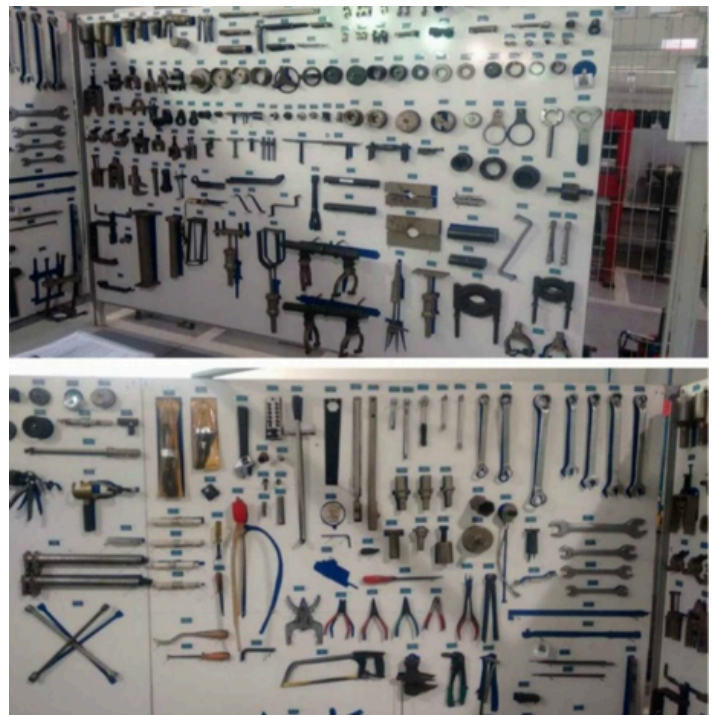
Figura 4: Ferramentas Organizadas

peciais foram organizados para sua utilização em serviços maiores e com maior complexidade, realizando quadro para separação deles. A