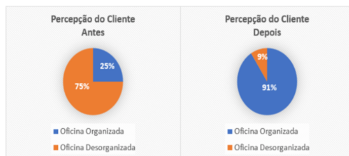
Quadro 1: Pesquisa Percepção do Cliente

Num universo de 100 entrevistados, apenas 9 avaliaram os serviços da oficina como desorganizados, o que representa uma melhoria de 66 pontos percentuais em relação ao período antes da implantação do 5S (Quadro 1). A pesquisa ainda revelou que 90% dos clientes