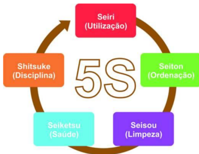
Figura 1: Conceitos do programa 5S

de grande apoio pessoal e financeiro. O 5S tem como objetivo a valo-