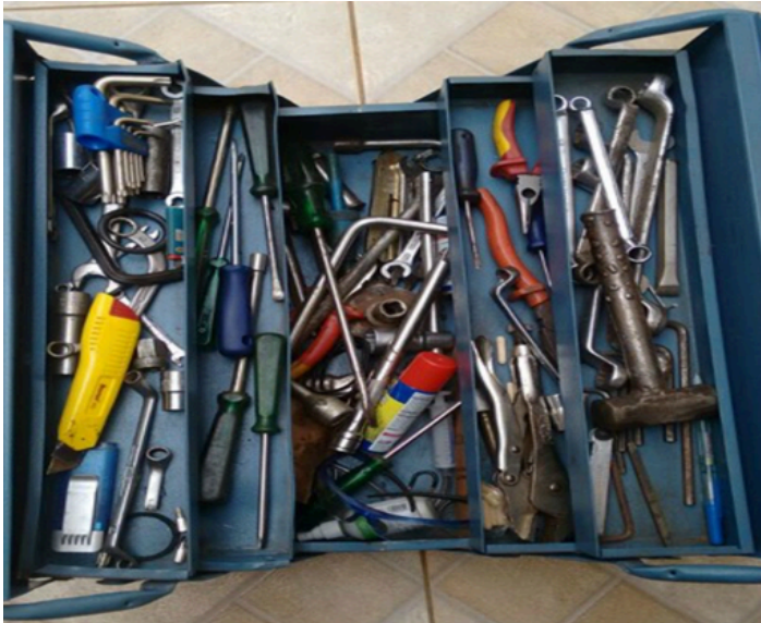
Figura 2: Caixa de ferramentas desorganizada