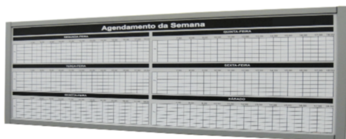
Figura 6: Painel de Agendamento de Serviços

Um colaborador ficou responsável por administrar a agenda, dar respostas aos clientes, tornando o processo mais ágil e prático. Na Figura 6, observa-se o exemplo do painel utilizado no agendamento eletrônico de serviços. A utilização permitiu o gerenciamento visual