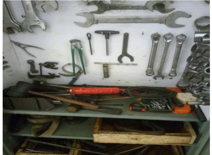
Figura 3: Local de armazenagem de ferramentas

Pode-se observar nas Figs. 4 e 5 como foram dispostas as ferramentas, separadas por uso diário e por tipo de serviço. Equipamentos es-